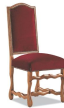
Chaise Louis XIII