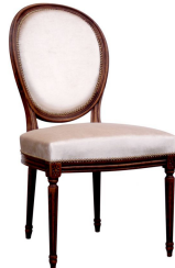
Médaillon Louis XVI