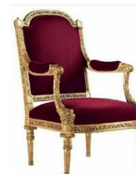
Fauteuil Louis XVI à écoinçons