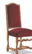
Chaise Louis XIII