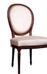
Médaille Louis XVI