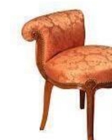
Fauteuil à crosse