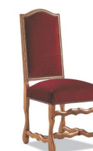
Chaise Louis XIII